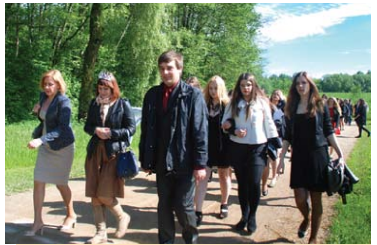
Anykščių Jono Biliūno gimnaziją šiemet baigė 178 abiturientai.

laukė vienuoliktokai su paruoštu spektakliu.