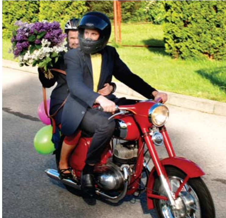
Iva klasės auklėtoja vežama motociklu „Java“.

Ketvirtadienį paskutinis skambutis nuaidėjo daugiau kaip 300 Anykščių krašto abiturientų. Didžiausią rajone Jono Biliūno gimnaziją šiemet baigia 178 abiturientai. Dauguma auklėtojų į gimnaziją atvyko papuoštais automobiliais, o porai auklėtojų pasisekė pasinerti į žemdirbių vaidmenį – juos atvežė į gimnaziją traktoriumi.