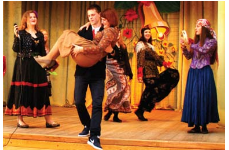
Auklėtinis taip džiaugėsi išvadavęs savo auklėtoją iš čigonų, kad nuo scenos nešė ją ant rankų.