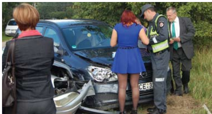
Rugsėjo 1-ąją J.Biliūno gimnazijos abiturientė sudaužė politiko Alfrydo Savicko automobilį.