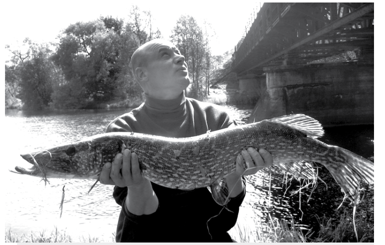
Rekordinis anykštėno žvejo laimikis Šventojoje.