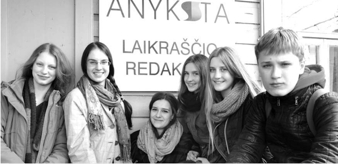
„Anykštos“ žurnalistų mokyklėlę lankė 7-12 klasių mokiniai.

Trečiadienį, paskutinę šių mokslo metų „Anykštos“ jaunųjų žurnalistų mokyklėlės dieną, su mokiniais susitiko buvęs Vilniaus meras Artūras Zuokas, o po to policijos pareigūnai jaunesiems žurnalistams surengė ekskursiją po Anykščių rajono policijos komisariatą.