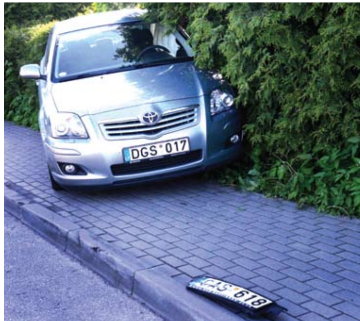
Kontrimavičiai vežėsi dar nė dvejų metų neturinčių anūkėlę. Smūgis teko galinei automobilio daliai - ten, kur sėdėjo mergaitė. Laimei mažylė buvo specialioje kėdutėje, prisegta saugos diržais, suveikė oro pagalvės, todėl mergaitė nenukentėjo.