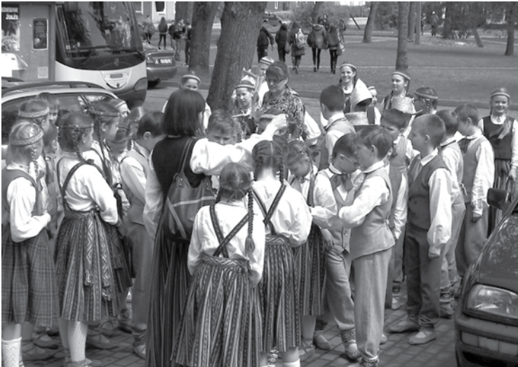
Į Svėdasus su nuotaikinga koncertine programa atvyko apie penkias dešimtis jaunųjų šokėjų ir dainininkų iš Daugpilio Vienības pagrindinės mokyklos.

Svėdasų kultūros namuose koncertavo Daugpilio (Latvijos Respublika) Vienības pagrindinės mokyklos moksleivių meno kolektyvai. Jie mokosi tame pačiame pastate, kur kadais mokslus krinto didysis svėdasiškis Juozas Tumas-Vaižgantas.