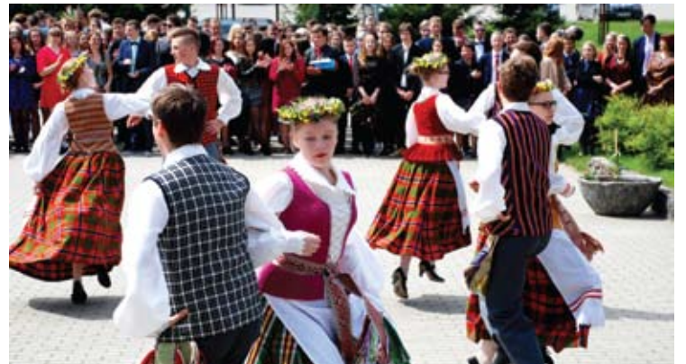
Abiturientai juos pasitikusius žmones apdovanojo šokiais.

Po paskutinio skambučio dvyliktokai nebelankys pamokų, bet mokykloje jie dar pasirodys. Vietoj pamokų jie eis į konsultacijas, per kurias ruošis brandos egzaminams.