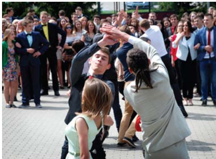
Abiturientus šokiais pasveikino jaunesni gimnazijos mokiniai.