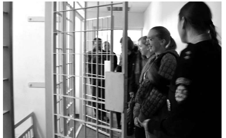
„Anykštos“ jaunesiems žurnalistams lankantis Anykščių rajono policijos komisariate buvo parodytos beveik visos patalpos. Tačiau į zoną, kurioje „sėdi“ areštuotieji, įeiti draudžiama ne tik ekskursantams, bet ir policijos pareigūnams.