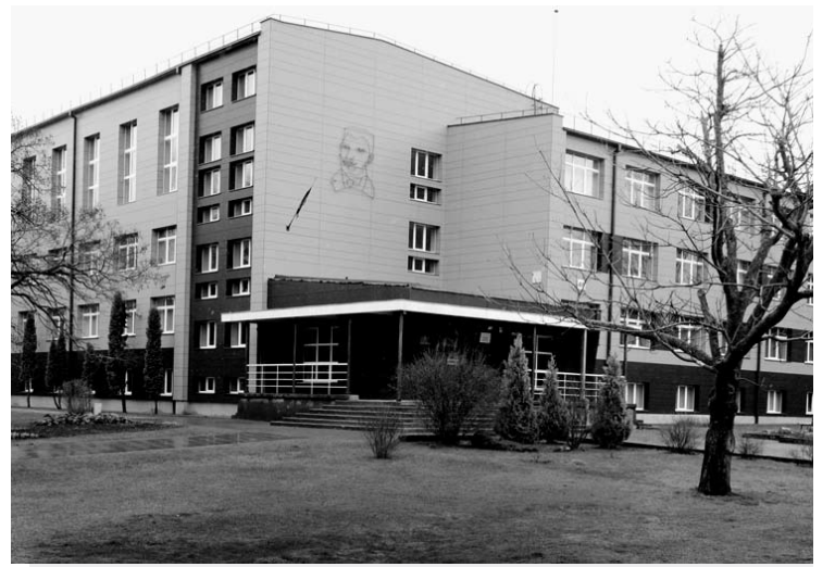
Anykščių J.Biliūno gimnazija bėgant metams, matyt, liks vienintelė mokykla rajone, kurioje bus galima gauti brandos atestatą

Palyginimui nereikia ir „caro“ laikų. Versdamas 1997 metais išleistą Anykščių rajono telefonų knygą joje radau Viešintų, Skiemonių, Kurklių, Debeikių vidurinių mokyklų telefonus. Tuo metu rajone buvo 7 vidurinės (ir dar 3 Anykščių mieste) bei 9 pagrindinės mokyklos. Pagrindinės mokyklos 1997 metais veikė Andrioniškyje, Ažuozėriuose, Burbiškyje, Dabužiuose, Kunigiškiuose, Staškūniškyje, Surdegyje, Raguvėlėje. Vienintelė Traupio mokykla, kuri 1997 m. buvo viena iš devynių rajono pagrindinių, savo statusą išsaugojo iki šių laikų. Kitų senųjų pagrindinių mokyklų vietoje liko griuvėsiai, geriausiai atveju – bendruomenių namai su šarvojimo sale.